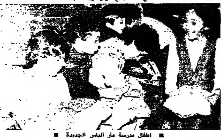
اطفال حضنة سن الليل يحملون الهدايا